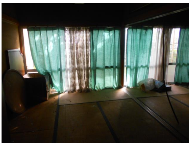
和室 2 (6畳)