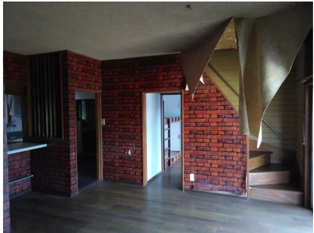
1 階洋室 (部屋 1)