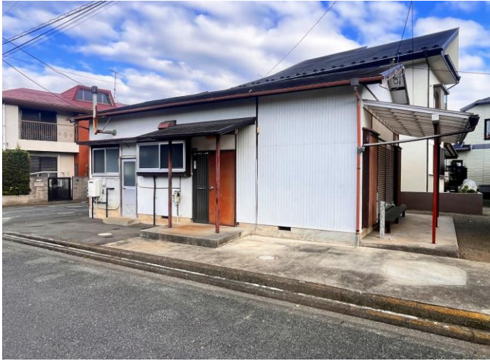
外 観 ①