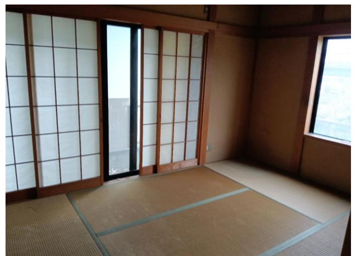
1階 和室 (部屋2)