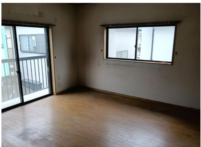
2階 洋室 (部屋5)