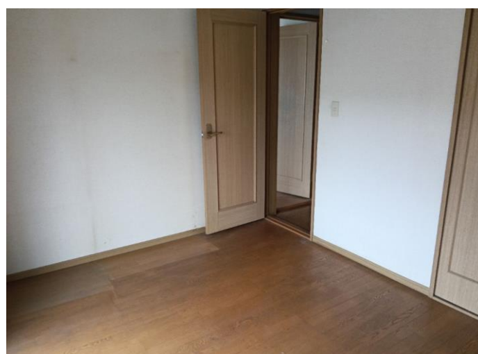
2階 洋室 (部屋4)