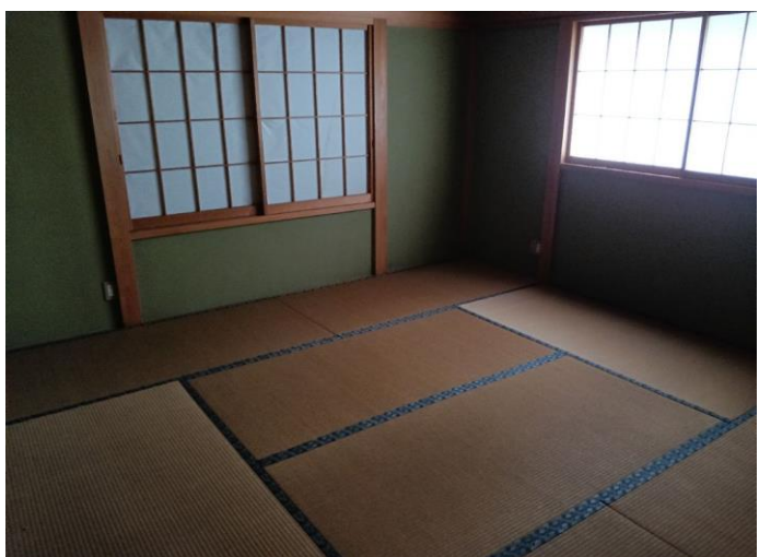
2階 和室 (部屋3)