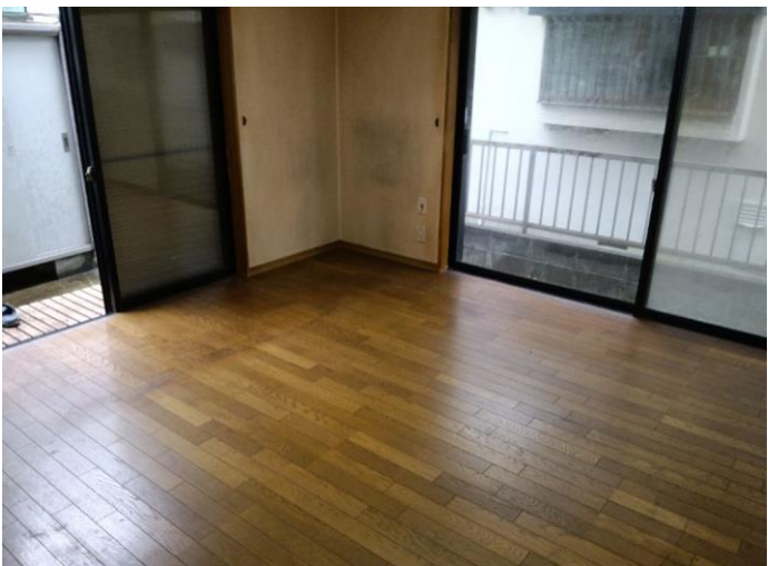
1階 洋室 (部屋1)