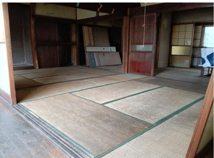
和 室 (部屋 1)