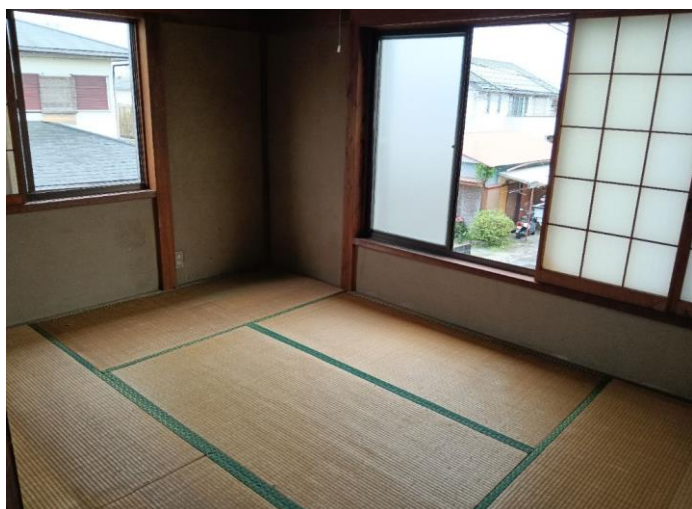
2階 和室 (部屋2)