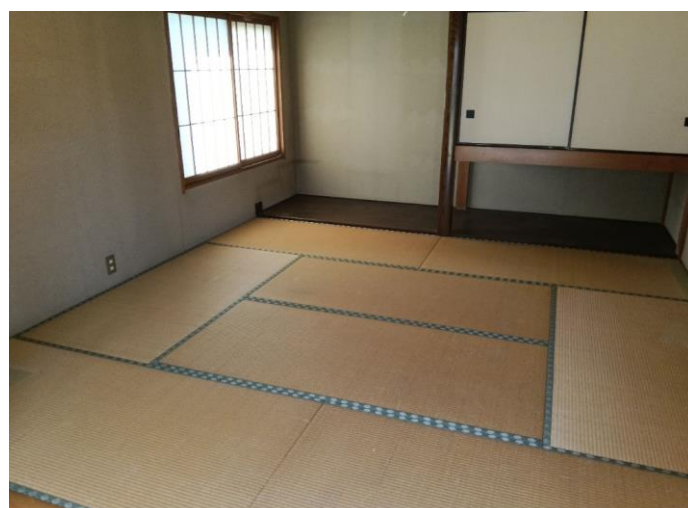
1階 和室 (部屋2)