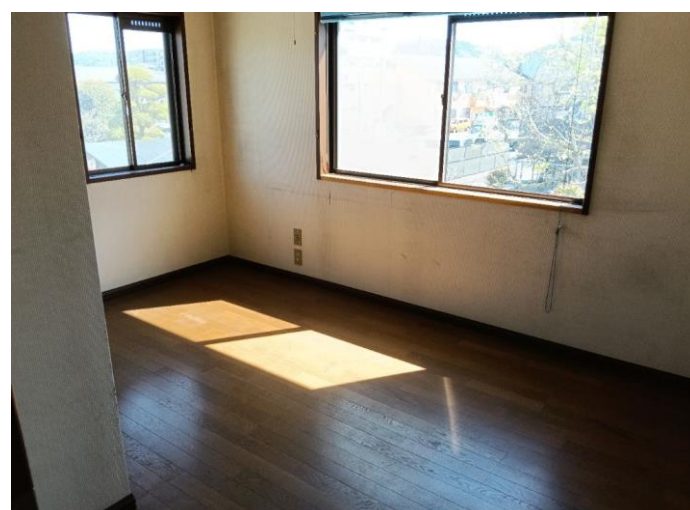
2階 洋室 (部屋4)