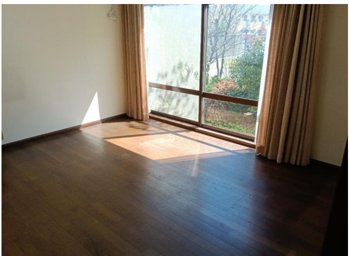
1階 洋室 (部屋1)