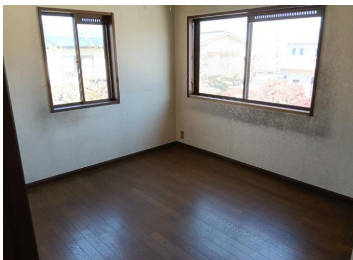
2階 洋室 (部屋3)