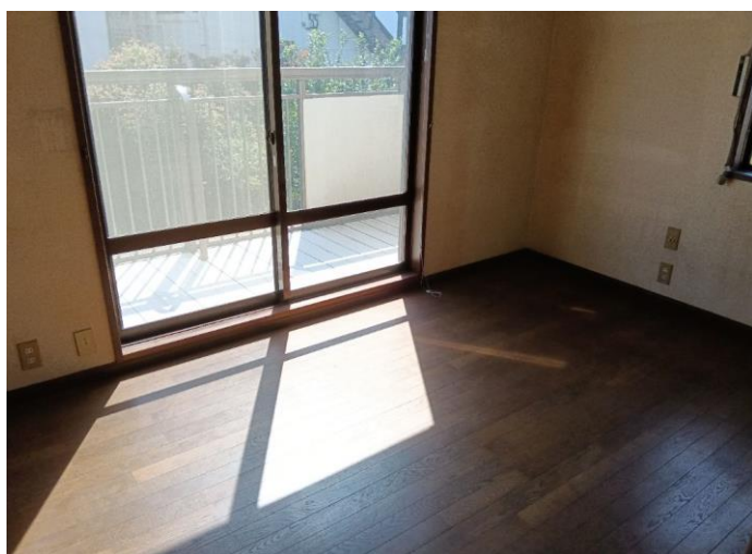
2階 洋室 (部屋5)