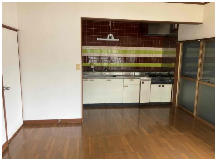
L D K