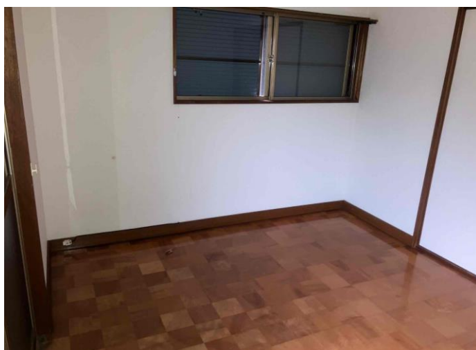
2階 洋室 (部屋2)