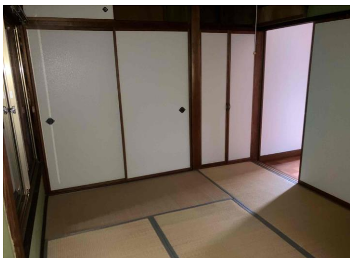
2階 和室 (部屋3)