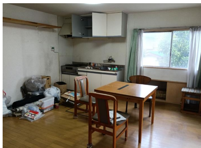
L D K