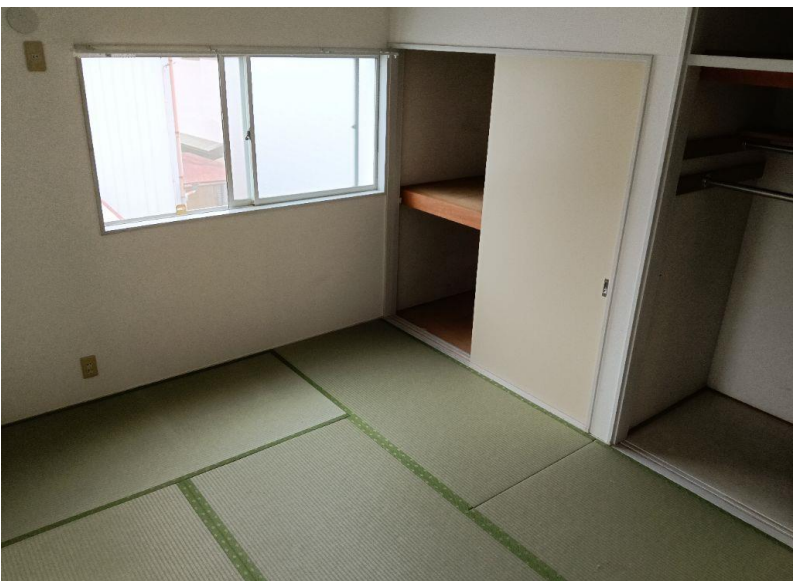
和室 (部屋 1)