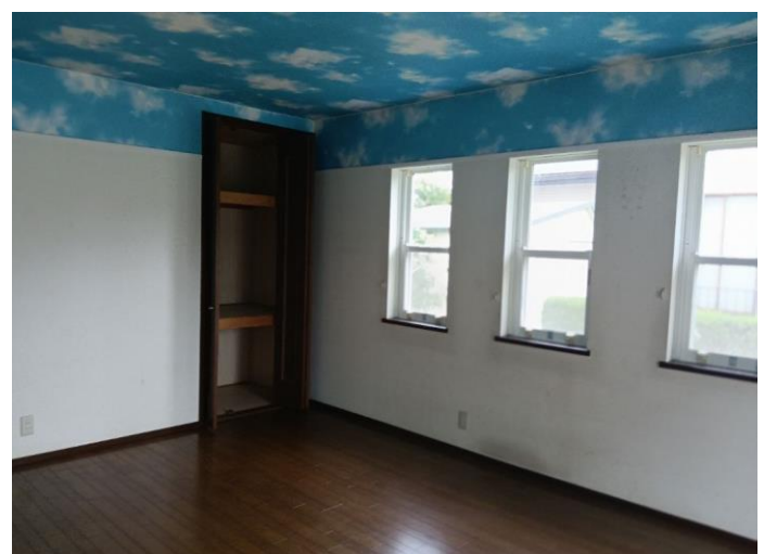
1階 洋室 (部屋2)