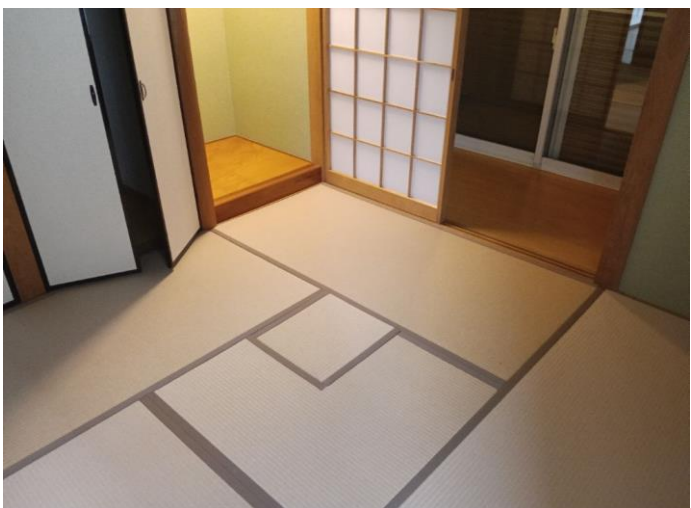
1階 和室 (部屋3)