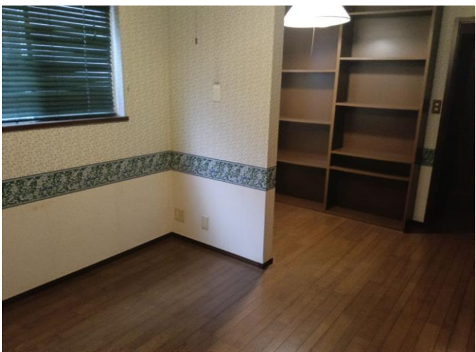
1階 洋室 (部屋1)