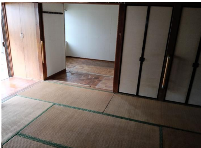
1階 和室 (部屋3)