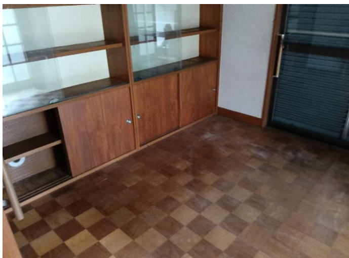
1階 洋室 (部屋1)