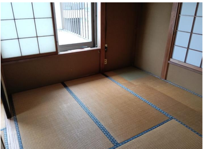
2階 和室 (部屋5)