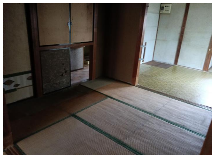
1階 和室 (部屋2)