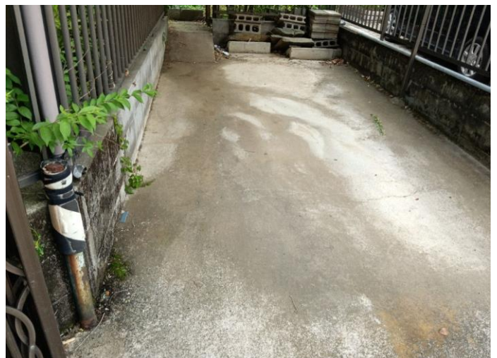
駐 車 場