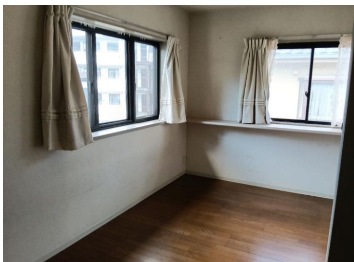
2階 洋室 (部屋2)