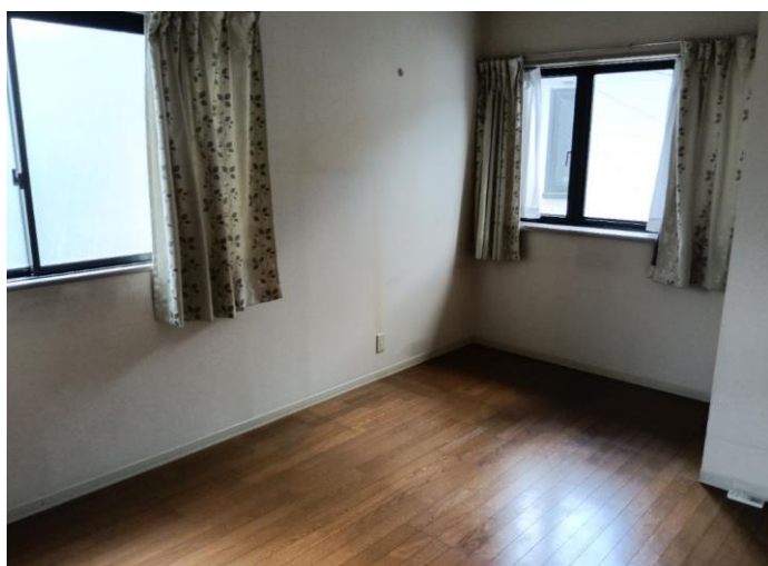
2階 洋室 (部屋4)