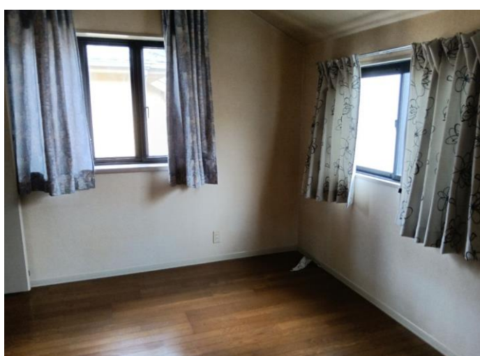
2階 洋室 (部屋3)